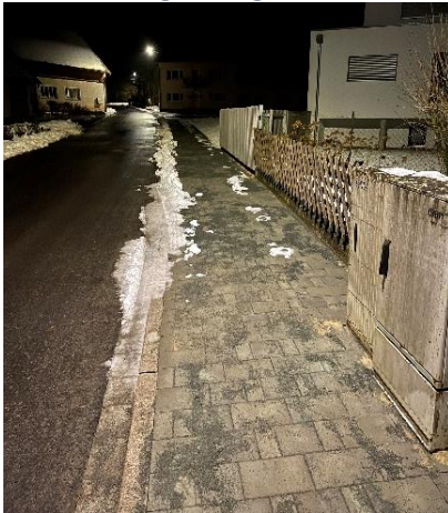
...ist die Gehbahn der Bürgersteig.